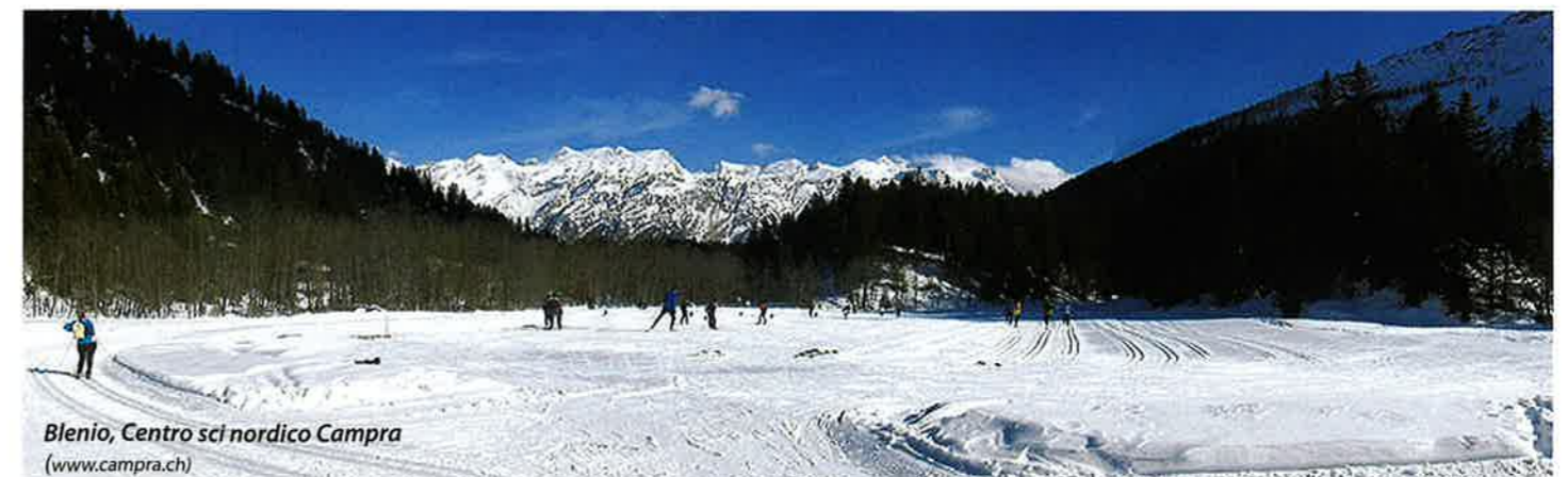
Blenio, Centro sci nordico Campra (www.campra.ch)

L'offerta outdoor, fortemente dipendente dalle condizioni meteo e dagli andamenti stagionali, è affiancata da offerte indoor che possano costituire una valida alternativa durante i periodi di cattivo tempo, come ad esempio la fruizione delle strutture sportive coperte nella Valle, ma pure a Biasca e in Leventina e la promozione di visite di giornata a Bellinzona.